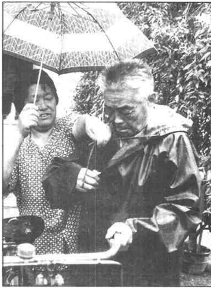
听说有户邻居闹家庭纠纷，他冒着雨前去调解。